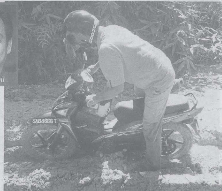
Joinin terpaksa menunggang dan menolak motosikalnya di sepanjang jalan serta lereng bukit berlumpur.

dengan haiwan yang mampu mengancam keselamatan saya di sepanjang perjalanan," katanya.