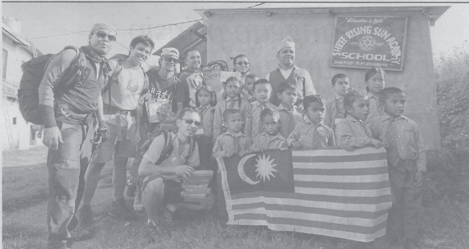
Lawatan ke Shree Rising Sun Academy, Dhampus, Pokhara, Nepal.