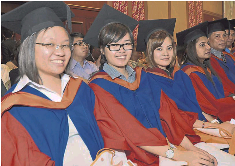
AeU 毕业生即将展开人生新旅途。