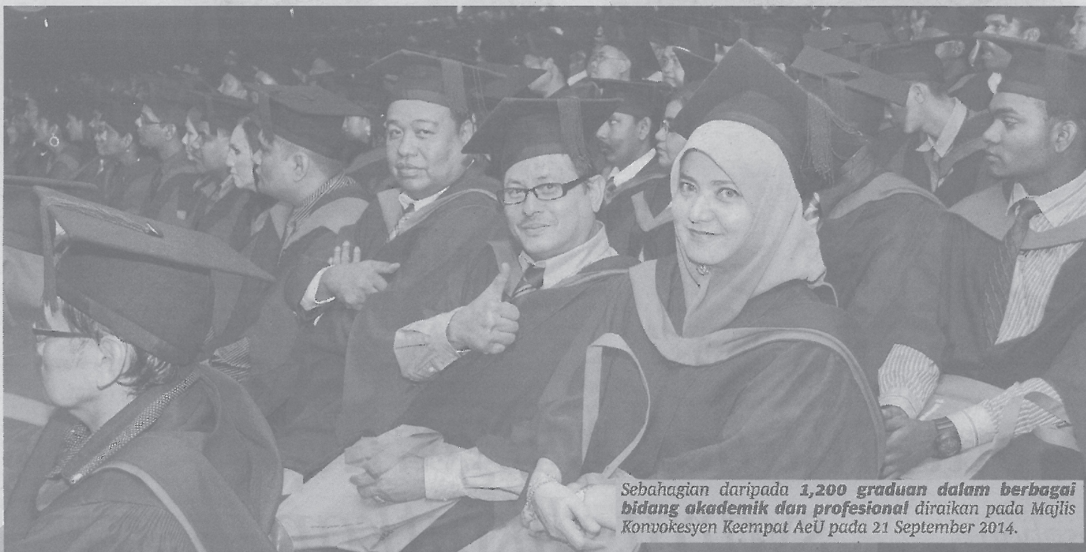
Sebahagian daripada 1,200 graduan dalam berbagai bidang akademik dan profesional diraikan pada Majlis Konvokesyen Keempat AeU pada 21 September 2014.